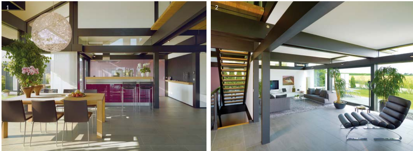
Grande image (haut) La pièce servant de bureau ou de chambre d'amis est très accueillante. Grande image (bas) La salle de bains, avec son sauna, est directement reliée à la chambre à coucher. 1+2 La cuisine, le coin repas et le séjour forment un grand espace ouvert.