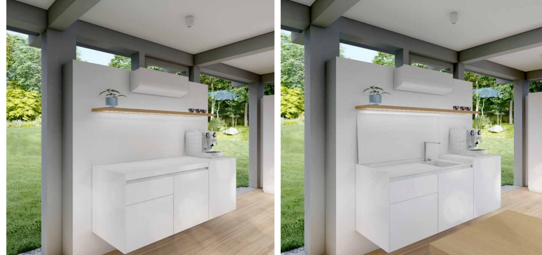
Ein Klappmechanismus lässt die Spüle im Handumdrehen verschwinden. So entsteht bei Bedarf zusätzliche Ablagefläche.