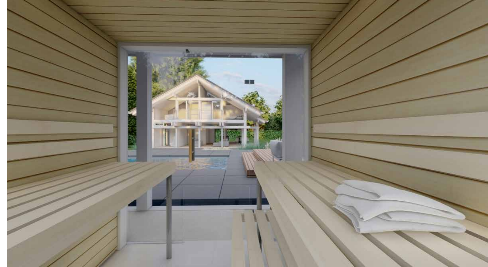
Ein Farblichtsystem in LED-Technik taucht die Sauna per Fernbedienung in die Wunschfarbe.