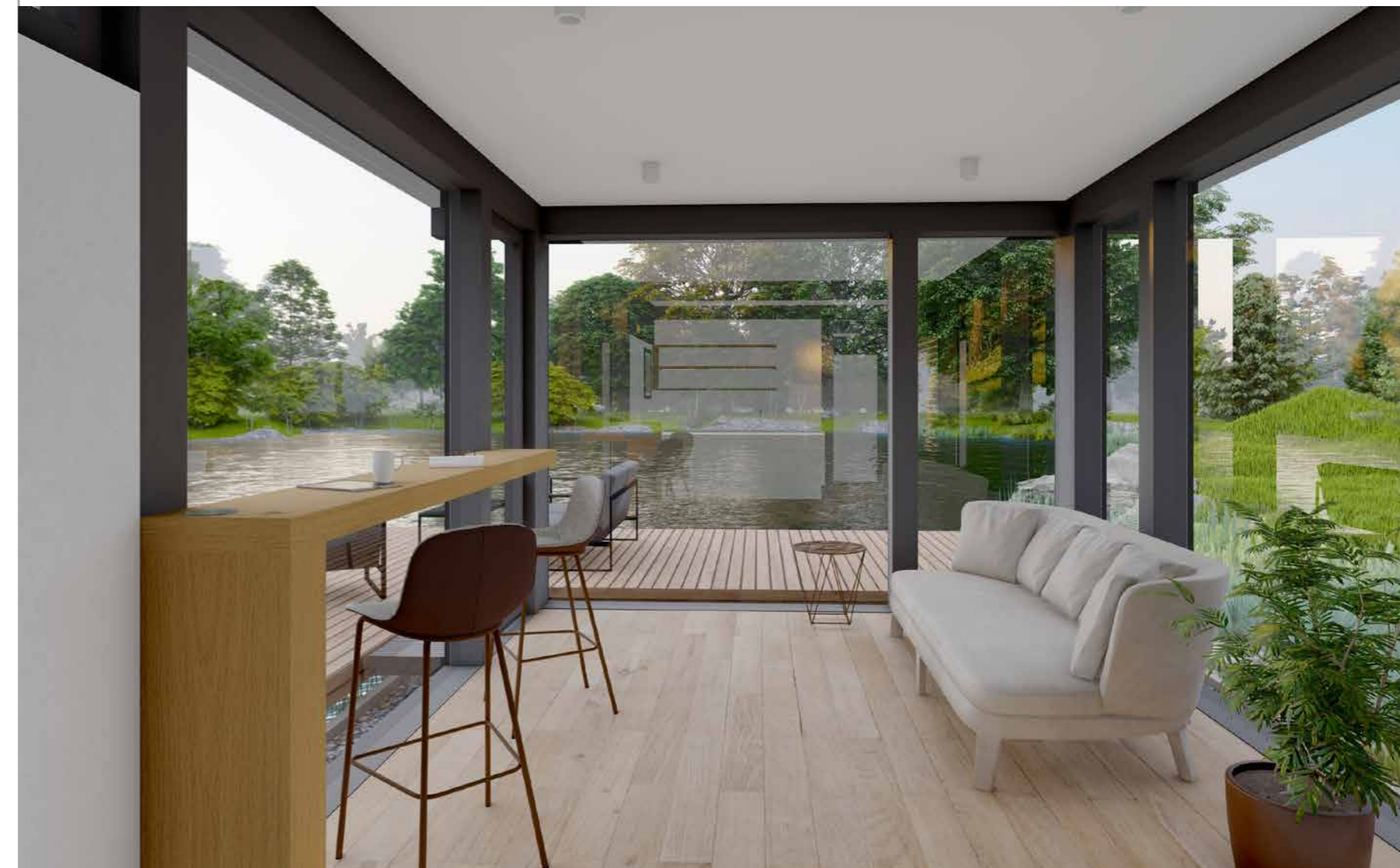
Auch die Innen- und Außenbeleuchtung wird auf Wunsch im Angebot ausgewiesen.