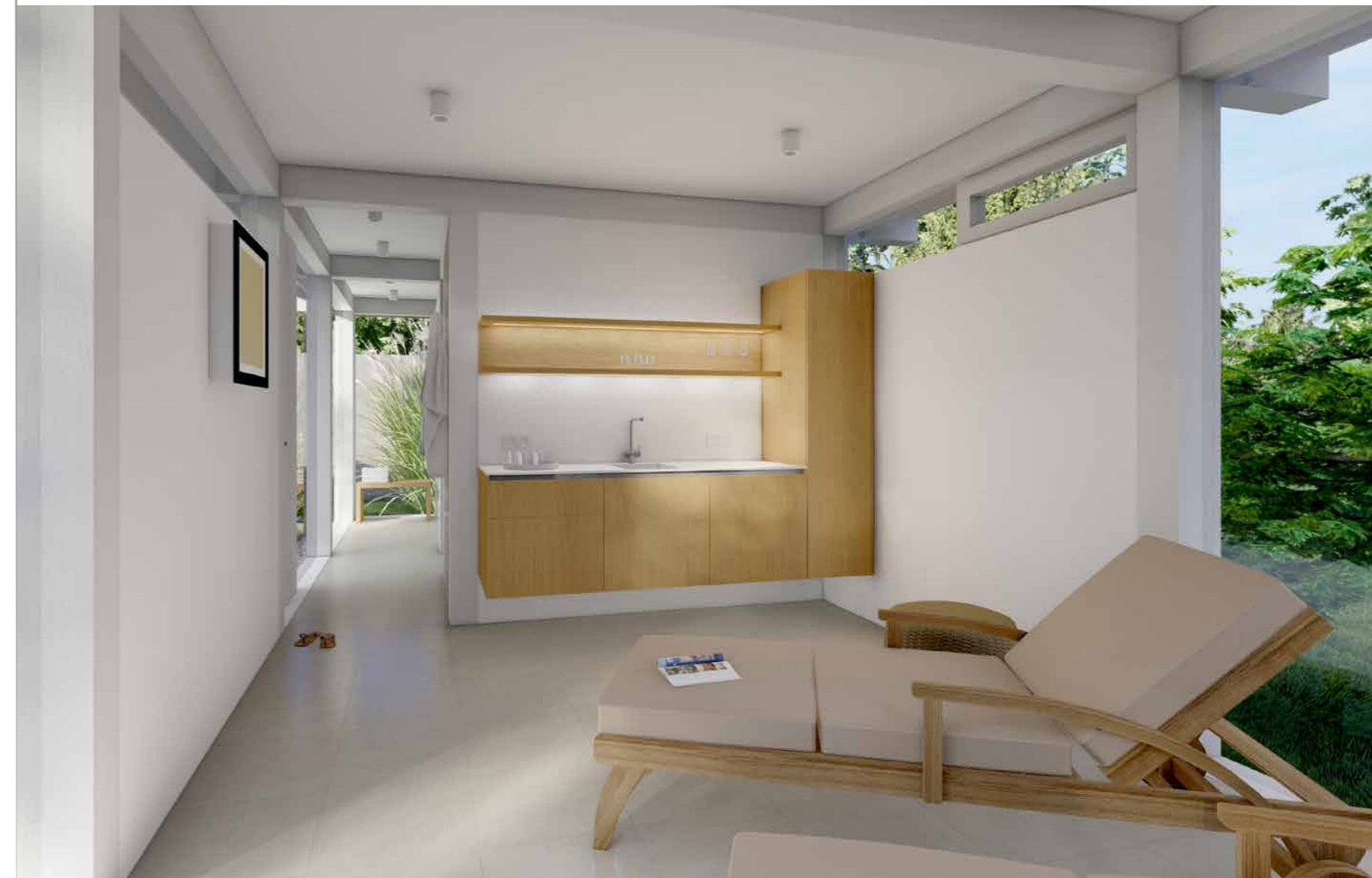
Erfrischung nach dem Saunagang: Kochendes, sprudelndes oder stilles Wasser aus nur einem Hahn.