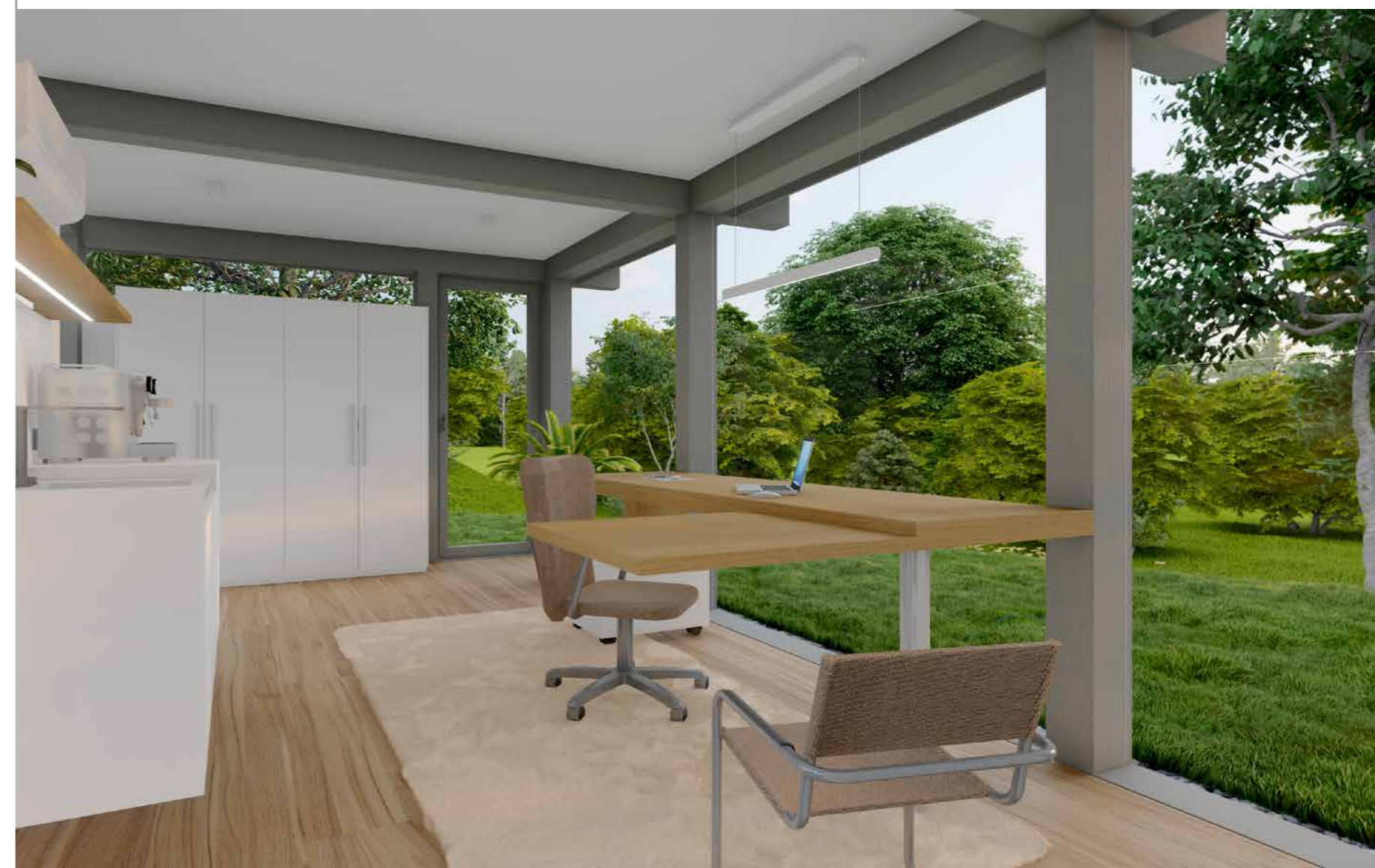
Vos clients et interlocuteurs sont les bienvenus : grâce à son second plateau pivotant, le bureau fonctionnel s'agrandit facilement.