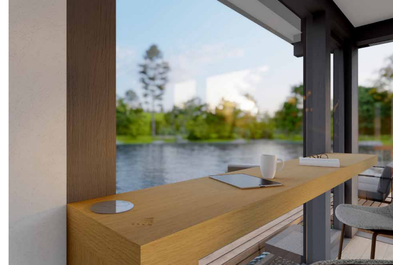
Le comptoir est équipé d'une station de recharge à induction.