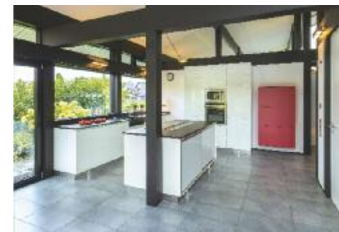
Bei einem offenen Grundriss stehen der Kommunikation keine Zwischenwände entgegen. Für ein Paar, das auch gerne Gäste empfängt, eine ideale Wohnform.

Die Hausbesitzer, die zuvor in einer Etagenwohnung lebten, sehnten sich bereits seit langem nach den eigenen vier Wänden mit Blick ins Grüne. Von der Transparenz und Offenheit der Fachwerkarchitektur beflügelt, fiel die Wahl auf Huf Haus. Mit der