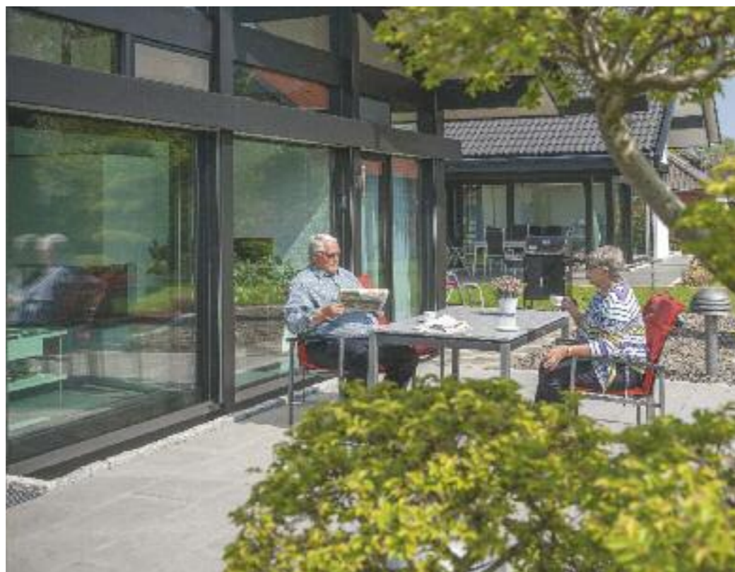
Die Terrasse ist das „Wohnzimmer im Freien“. Möglichst schwellenlose Übergänge erleichtern die Nutzung des Außenbereichs.

Ohne Treppen und Schwellen – so sieht komfortables Wohnen aus. Viele Bauherren denken bei ihrem Neubau auch an später, denn die eigenen vier Wände sollen möglichst bis ins hohe Alter Komfort und ein selbstständiges Leben ermöglichen. Dieser Bungalow erfüllt alle Wünsche.