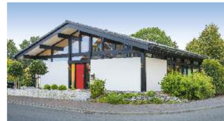
Auf der Gartenseite öffnet sich der Satteldach-Bungalow mit großflächiger Verglasung und holt auch bei bewölktem Himmel viel Tageslicht in die Räume.

Ohne Treppen und Schwellen – so sieht komfortables Wohnen aus. Viele Bauherren denken bei ihrem Neubau auch an später, denn die eigenen vier Wände sollen möglichst bis ins hohe Alter Komfort und ein selbstständiges Leben ermöglichen. Dieser Bungalow erfüllt alle Wünsche.