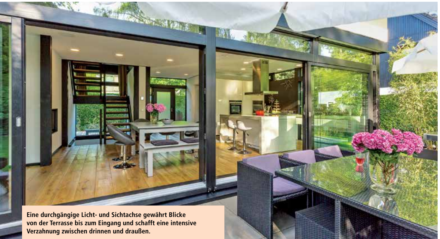
Eine durchgängige Licht- und Sichtachse gewährt Blicke von der Terrasse bis zum Eingang und schafft eine intensive Verzahnung zwischen drinnen und draußen.